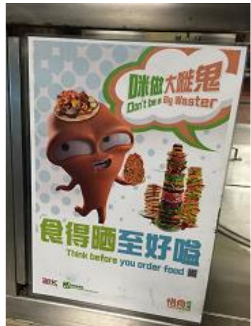
食堂當眼處的海報， 以鼓勵同事減少廚餘