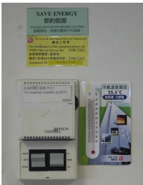
把室溫設定在攝氏25.5度