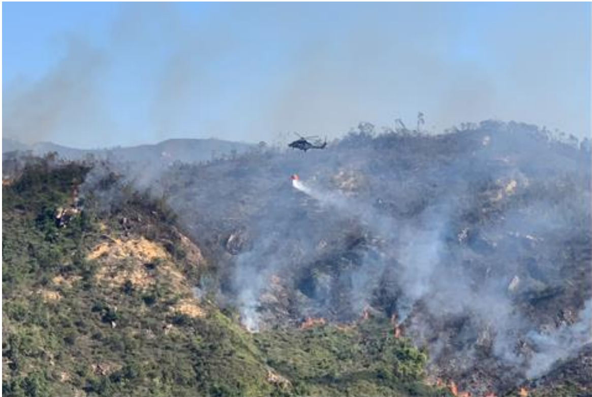
直升機執行滅火行動

我們的直升機亦協助漁農自然護理署在防止山火的宣傳活動中進行「空中廣播」活動。在星期日和公眾假期，特別是重陽節和清明節，我們的直升機會飛往郊區，透過擴音器向公眾播放預先錄製的防止山火訊息。