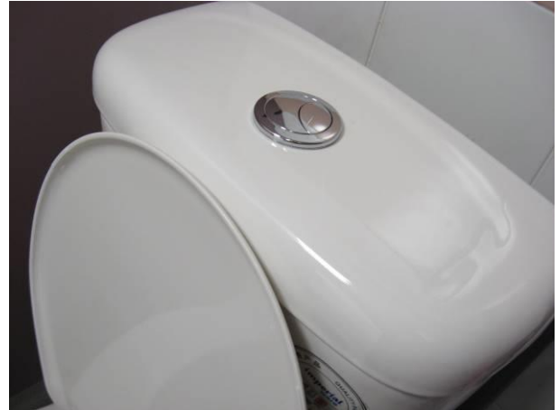
具節約用水效能的坐廁沖水裝置